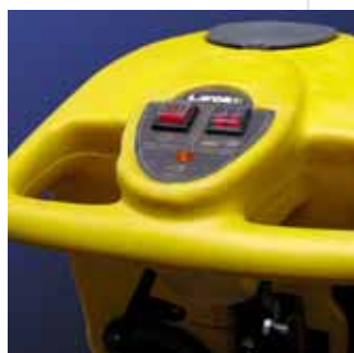
Panel de mandos Nox