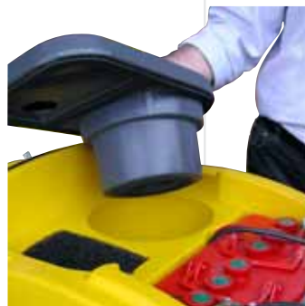
Inspección del motor de aspiración y del filtro