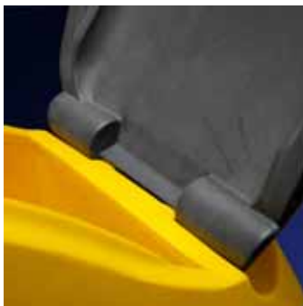
Tapa desmontable sin necesidad de herramientas