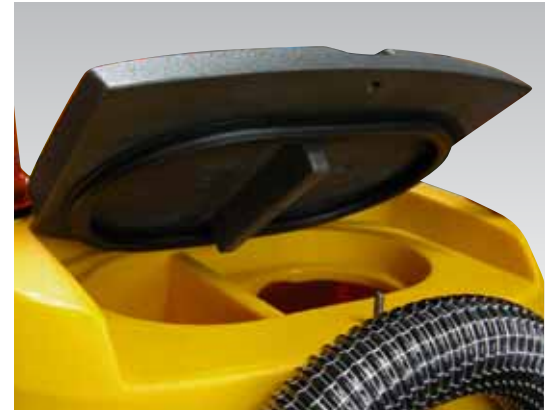
Tapa y filtro del depósito de recuperación