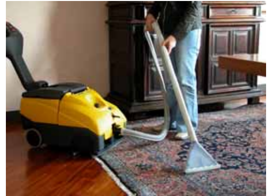
Posibilidad de conectar el accesorio de limpieza de moqueta (opcional) cod. 6.505.0008