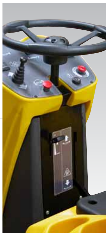
Espacio porta accesorios