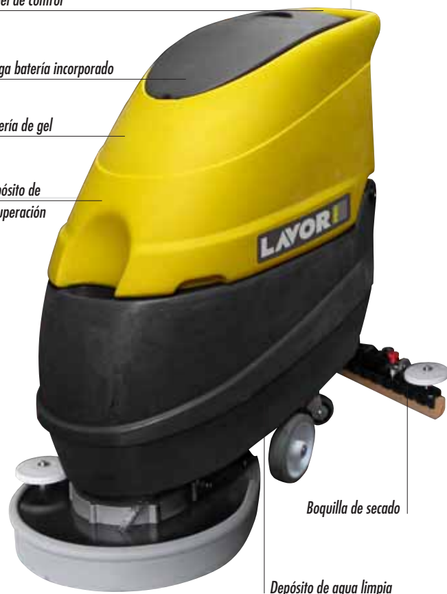
Depósito de recuperación