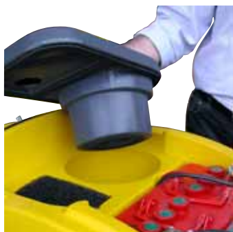
Abertura motor de aspiración y filtro