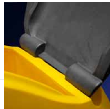
Tapa desmontable sin necesidad de herramientas