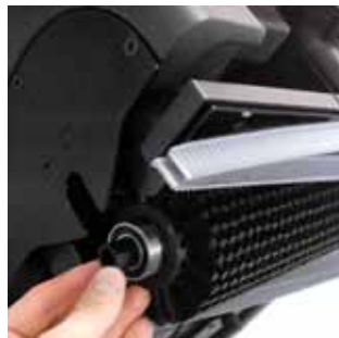
Enganche rápido del cepillo sin necesidad de herramientas