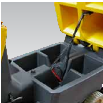
Alojamiento para las baterías

• Nº y capacidad max de baterías(opcional) 4x 6V/ 240 Ah C5 1200 ciclos