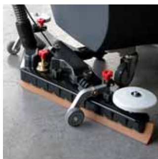
Boquilla de secado

* Bajo pedido, las versiones a baterías con tracción: