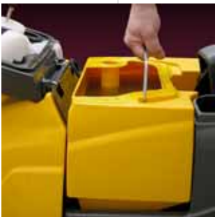
Práctico vaciado del depósito de recuperación